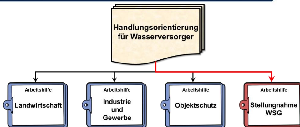
Abbildung 1: Dokumentenhierarchie